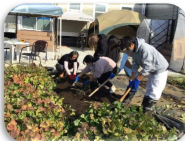
休憩時や学習後には収穫作業も