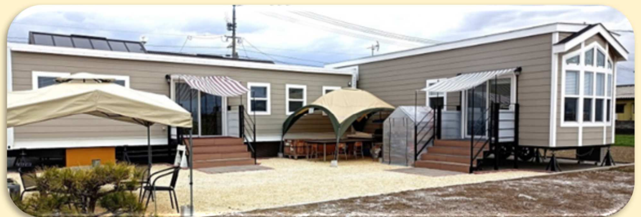
2台のトレーラーハウス。学び舎(左)と語り舎(右)